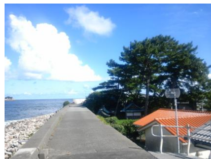
出羽島診療所(オレンジ屋根)